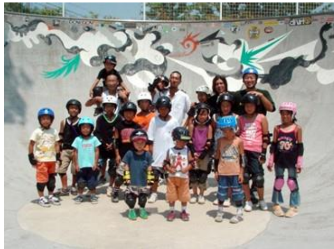
上鳥羽小学校 課外授業